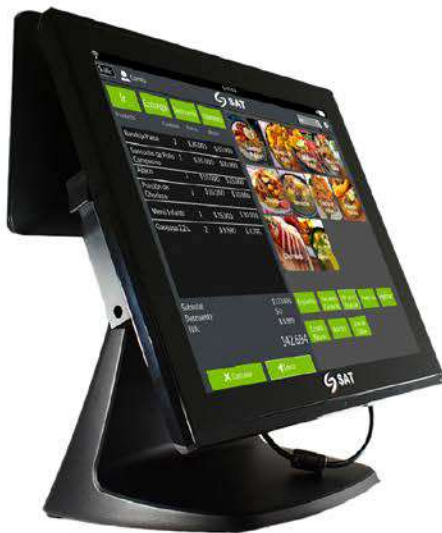
EQUIPO AIO SAT CI150