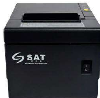
Impresora Térmica SAT 38T