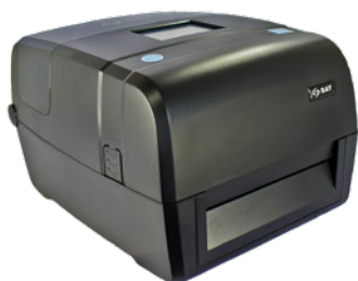
Impresora de etiquetas SAT ST48-USE LCD