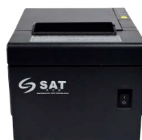
Impresora POS SAT 38T