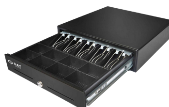
Cajón Monedero SAT 119Z