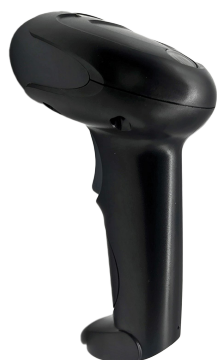
SAT AI402 ID OCR