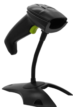
SAT LD101R PLUS