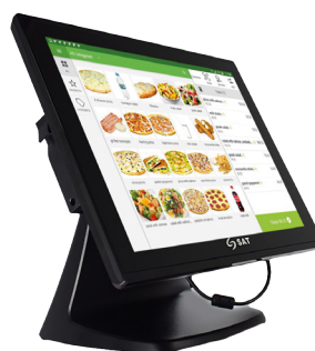
AIO POS CI150